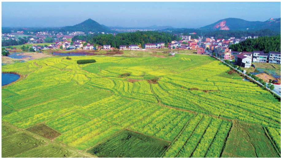
▲枫林镇油菜花