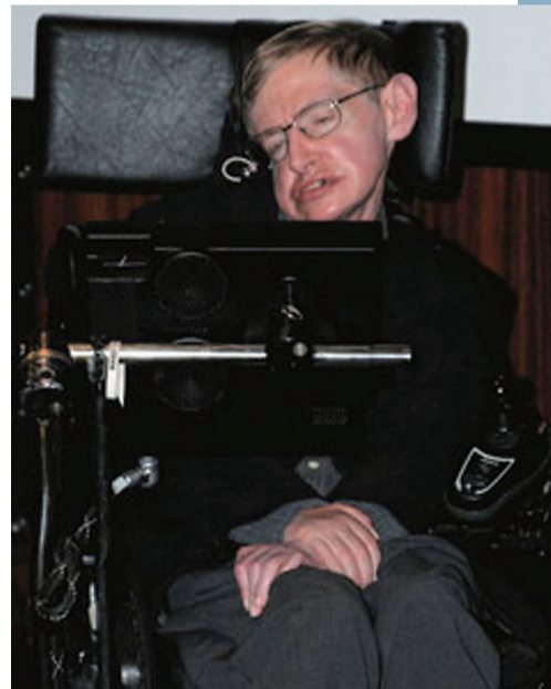
▲2006年,坐在轮椅上的霍金

如今,逝者已矣,霍金虽然没有成为他梦想中成为的那个人,但是有一点是不会变的,他坐在轮椅上不能开口说话,却依旧坚持科研工作的精神是人们所需要的,也将一直激励全人类。(本报综合)