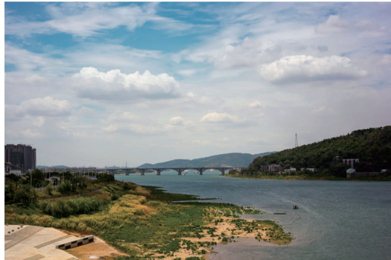
▲6月底前,我市将完成对湘江饮用水水源保护区内7个入河排污口的整改提升

本报讯(记者 伍靖雯 通讯员 凌小丽 曾昭旭 易娟)日前,全省第3号、第4号总河长令发布,部署水环境治理多项实施重点。记者昨日从市河长制委员会办公室获悉,今年我市计划通过开展黑臭水体治理、饮用水源地综合整治等多方面工作,提升河湖生态面貌,确保居民饮水安全。