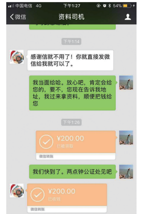
▲司机向乘客索要费用(微信截图)