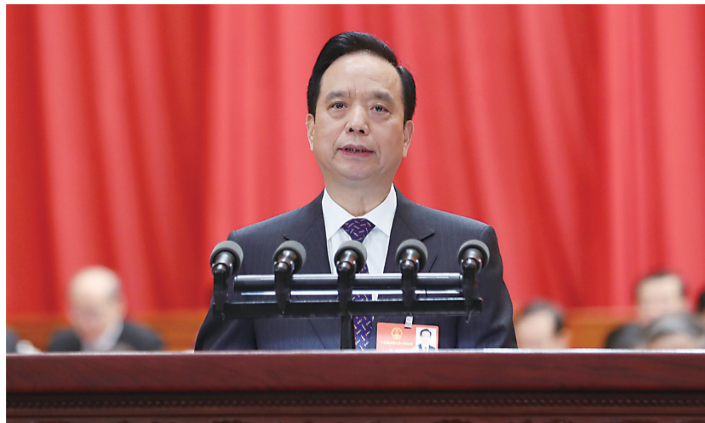
▲十二届全国人大常委会副委员长李建国作关于监察法草案的说明