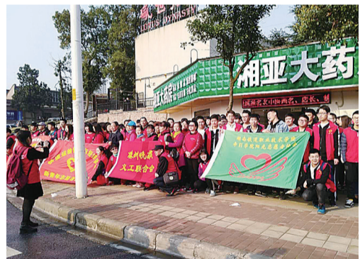
晚报志愿者联合会等团队在芦淞区参加义务植树

学院“小红帽”“新青年”“蒲公英”志愿者团队,以及湖南铁道职业技术学院牵引社会实践部、运营管社会实践部的志愿者团队,共250余人。“我会回来看它的!”市公交公司的志愿者袁先生和两名同事一起,种下了一棵香樟。他说,植树不仅仅是为了“3·12”,更是为了“365”。