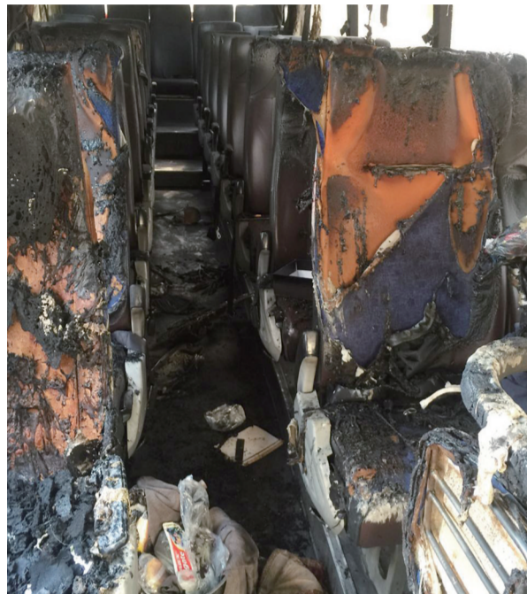
▲车厢前部被烧得面目全非

本报讯(记者 戴凇)前日傍晚，荷塘区一家旅游公司停车场内，一辆大客车突然冒出滚滚浓烟。经工作人员初步调查，这次火灾可能是一个未熄灭的烟头引起的。