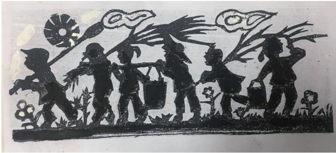
剪影是对人或事物轮廓的描述,属于剪纸艺术范畴。“植树去”就是用的剪影的方式来体现这一节日。