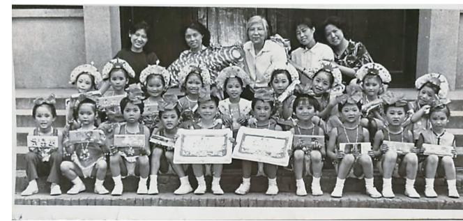
照片拍摄于1982年6月1日,株洲汽车齿轮厂幼儿园参加市六一文艺汇演《金色的童年》获得了一等奖,带队老师和小演员们合影。时光一晃就过去20多年了,光阴似箭啊!