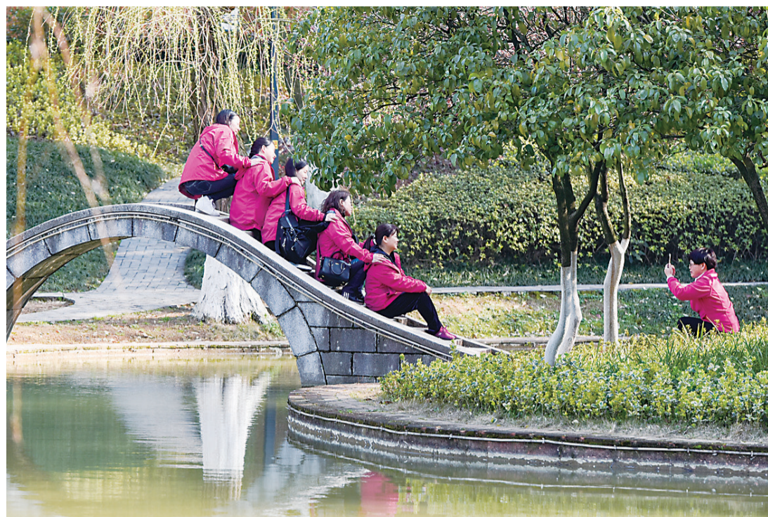
▲3月8日,天气转为晴好。在石峰公园,几位女同胞在阳光下合影