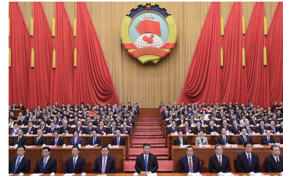
▲习近平、李克强、张德江、俞正声、张高丽、栗战书、王沪宁、赵乐际、韩正在主席台就座

凝心聚力携手新时代,继往开来创造新辉煌。经历光荣岁月、坚持团结和民主两大主题的人民政协,又迎来一个重要的历史时刻:中国人民政治协商会议第十三届全国委员会第一次会议3日下午在人民大会堂开幕。 党和国家领导人习近平、李克强、张德江、俞正声、张高丽、栗战书、王沪宁、赵乐际、韩正等在主席台就座,祝贺大会召开。 下午3时,汪洋宣布大会开幕,全体起立,高唱中华人民共和国国歌。