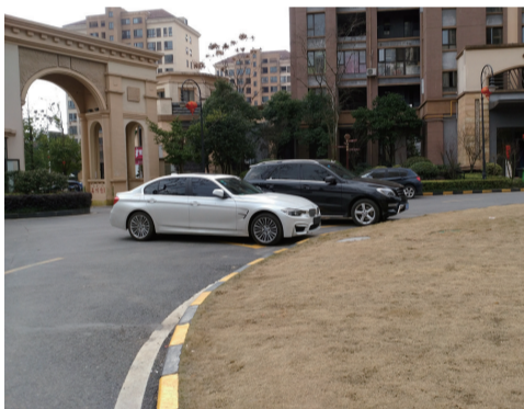
▲小区内道路存在乱停乱放的现象