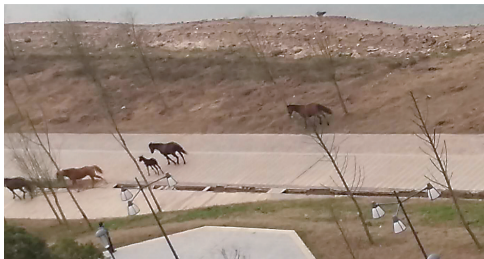
▲几匹马被牵到河东湘江风光带

本报讯(记者 贺天鸿)“东边牧马,西边放羊,火辣辣的情歌就唱到了天亮。”一曲《月亮之上》风靡大江南北,勾起很多人向往草原的欲望。不过,昨天,市民李女士拨打晚报新闻热线28829110反映,近期河东风光带纺织路附近,也能看到骏马的身影。这些马匹经常会跑到风光带上拉屎,还啃食草皮,希望有关部门能及时监管。