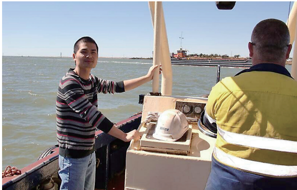
▲一位从株洲走出去的海员正在船上工作