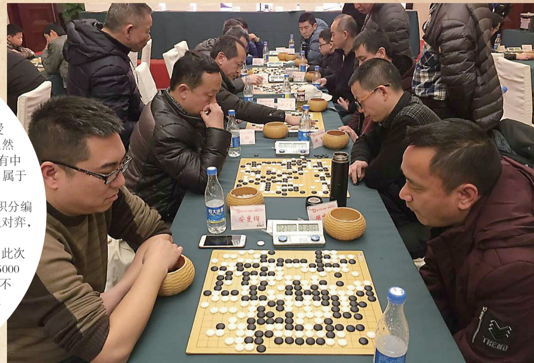
▲比赛现场

本报讯(记者 赵露)昨日上午,株洲市棋类协会举办的2018年株洲市第三届象棋、围棋棋王赛正式开赛。来自我市各区县市的100多名象棋、围棋爱好者在现场展开对弈。据悉,此次比赛参与者虽然都是业余棋手,但参赛者水平较高,围棋选手大多有中国棋院颁发的围棋三段以上证书或其他资格认证,属于我市围棋比赛中规格较高的。株洲市棋类协会秘书长尹辉称,比赛采用电脑积分编排、9轮竞赛的方式,第一场比赛电脑将随机安排两人对弈,随后按照积分排名,排名较高的选手之间进行对决。尹辉称,此次比赛将持续两天,今天下午将决出此次比赛的冠军。冠军将获得“株洲棋王”称号,并获得5000元奖金,第二至第十六名也将获得3000元至500元不等的奖金。此外,获得“棋王”称号的棋手将代表株洲与省内其他城市进行“棋王”对抗赛,进一步扩大株洲市在湖南省棋类活动中的影响力。