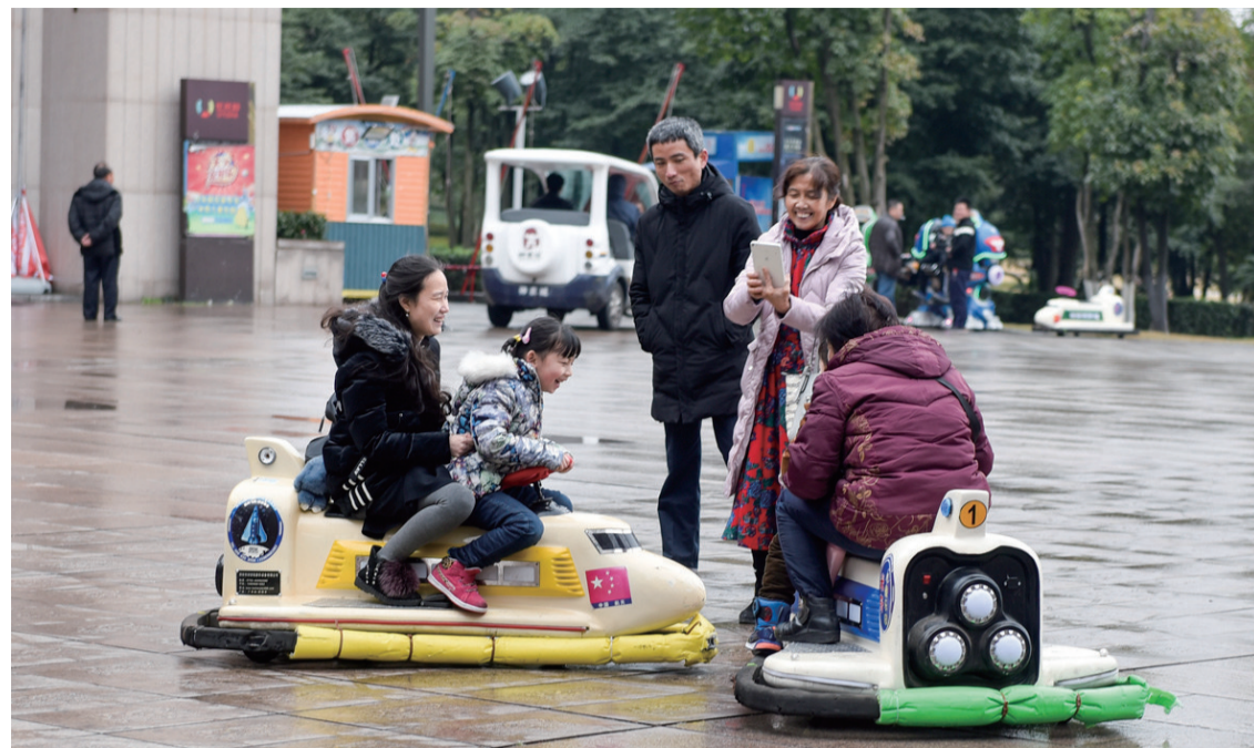
▲昨日,市民们在神农城广场尽情游玩