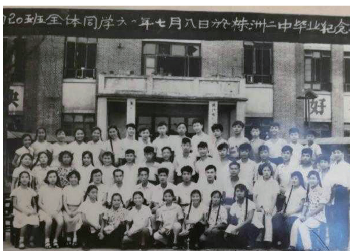
照片是1961株洲二中初20班的毕业纪念照。大家人老心不老,相互走动,还时常聚会,高高兴兴过着每一天。