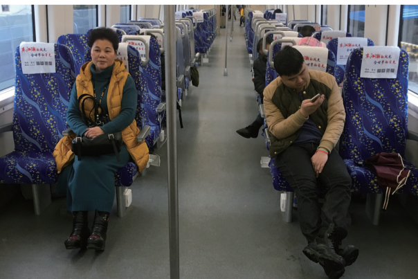
▲昨日,城铁乘客寥寥无几

也有市民表示,平时去长沙、湘潭习惯了开车、坐大巴,想走就走,而株洲到长沙的城铁一天只有12趟,间隔时间较长。再加上春节期间各种安排较多,自行开车更能应对变化。