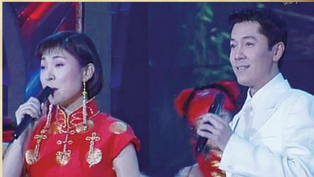
▲陈红(左)与蔡国庆(右)在1999年春晚合唱《常回家看看》

1960年代,铺张浪费、摇钱赌博的一些旧风气在社会上卷土重来,此时“以革命的精神过春节”的号召也相应而来,反对敬神祭祖、大吃大喝,以健康、节俭的态度过节遂成风尚。