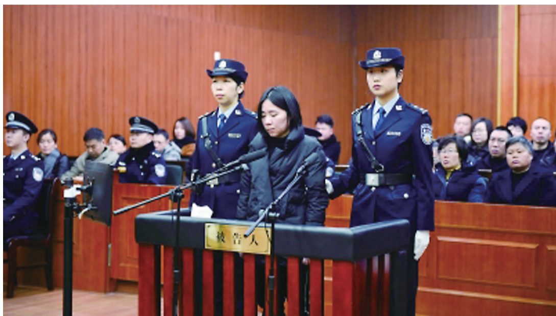
▲杭州保姆纵火案宣判现场