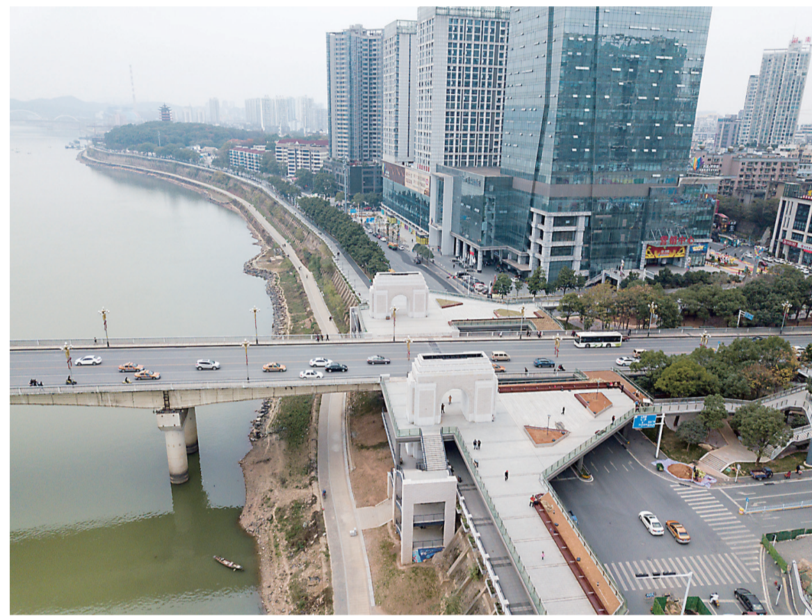
▲昨日,沿江路全线贯通。图为沿江路城市阳台路段

本报讯(记者 肖蓉 通讯员 潇雅 刘文华) 昨日,湘江株洲城区河东段综合治理工程(以下简称河东风光带)沿江路项目全线贯通。该项目北起石峰大桥,南至株曲路口,全长9.2公里。随着沿江路的全线贯通,它也成了河东中心城区继建设路、人民路后,第三条南北走向的主要干道,将大大缓解建设路交通压力。