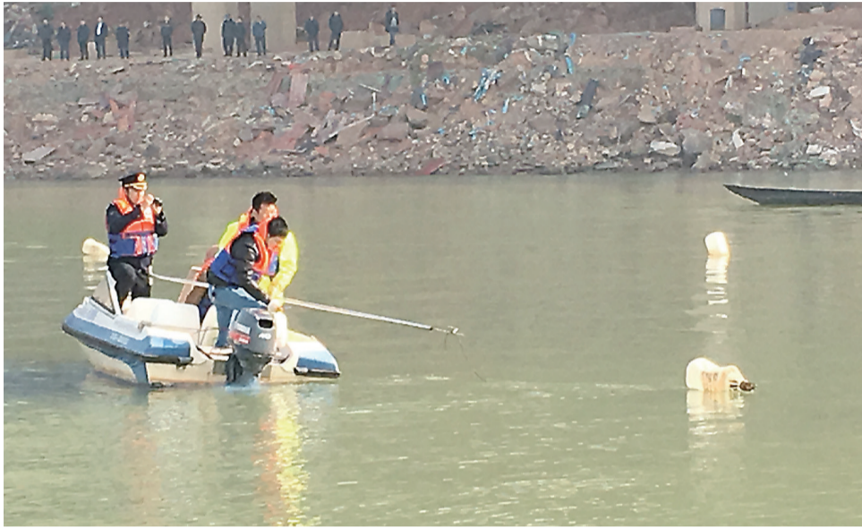
▲多部门联合执法巡查湘江水域

另外,在陆路巡查、水上巡查的基础上,湘江巡查又增加了无人机空中巡查,立体化、多层次监管湘江,实现湘江管理无盲区、无死角。还设立了监督举报电话,与市长热线并网,全天接受群众、新闻媒体、志愿者举报,以便及时消除隐患,保护水环境。不仅如此,还设立了奖励基金,出台举报奖励具体办法,鼓励全社会共同保护湘江、保护母亲河。