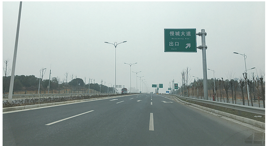
▲建成通车的湘江大道(一期),让市民出行更加安全便捷

另外,该局积极践行“马上就办”,开展了超限超载专项治理、武广西站客运市场秩序专项整治、出租汽车非法营运行为专项整治、市县班线非法营运集中整治等大型整治行动10余次,维护运输市场秩序,保障了群众安全。