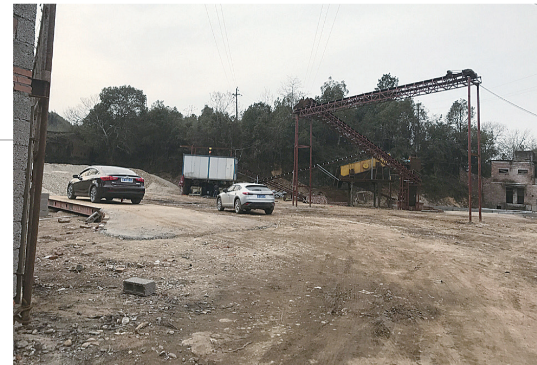
▲碎石场上机器正在生产,旁边就是民房

昨天,记者了解到,中国移动株洲分公司工作人员已经与丁老师联系,咨询相关情况。此事进展如何,“市长热线督办”栏目将继续关注。