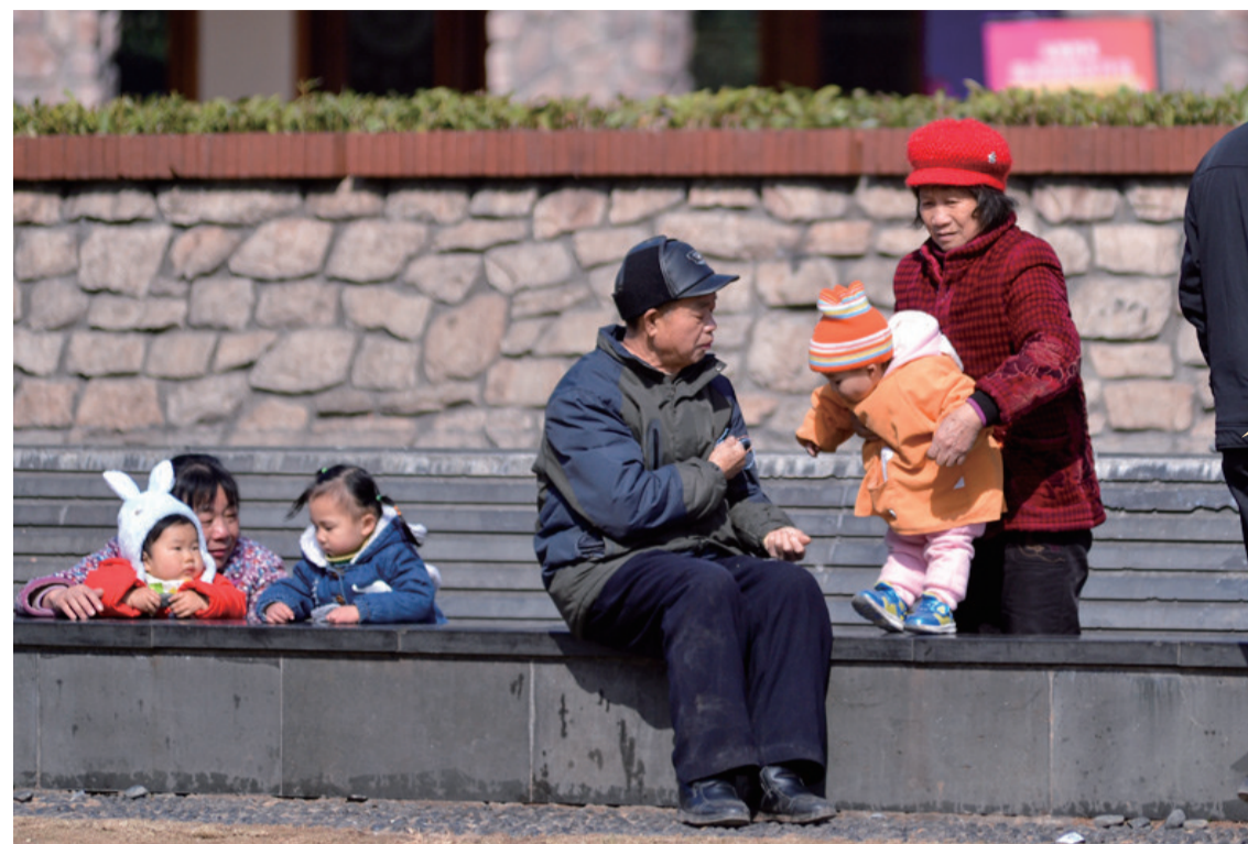
▲昨日,荷塘区向阳北路与新塘路交界处,家长们带着孩子沐浴阳光

伟大的心胸,应该表现出这样的气概——用笑脸来迎接悲惨的厄运,用百倍的勇气来应付一切的不幸。——鲁迅