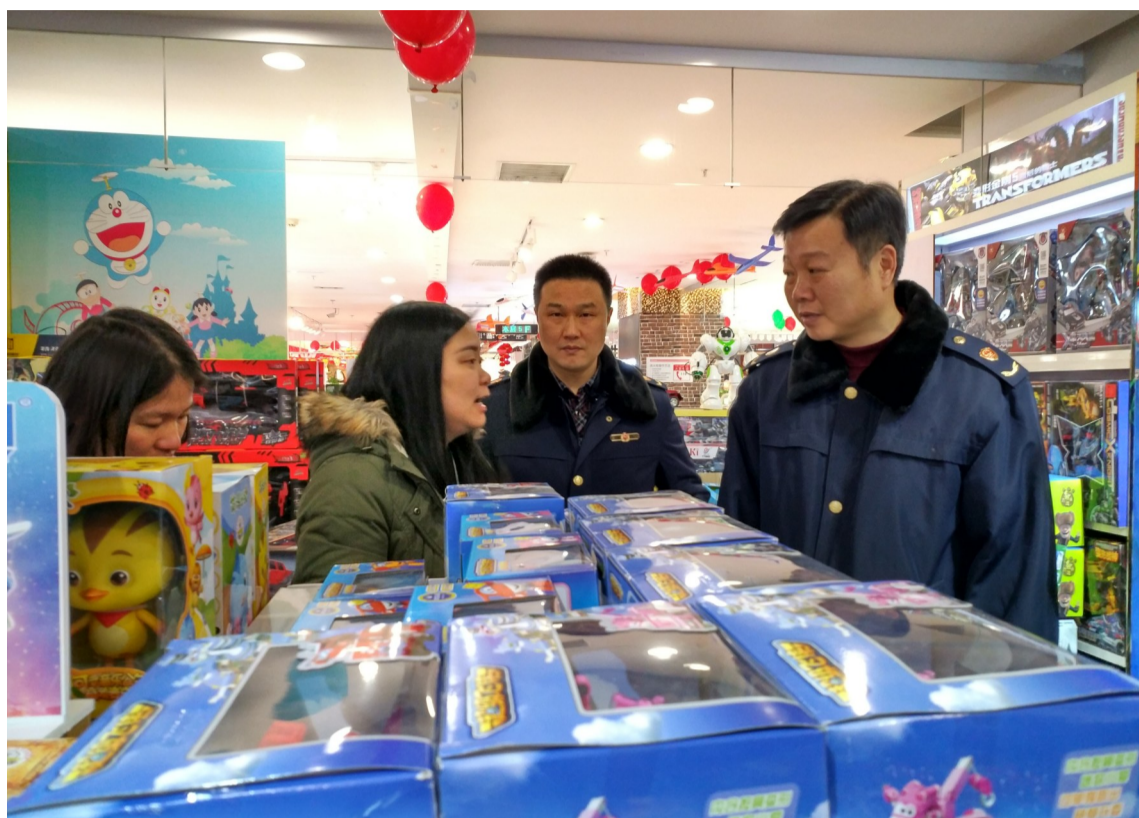
▲工商执法人员对节前消费市场开展检查