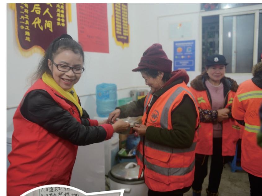
▲志愿者将下好的米粉端给环卫工品尝