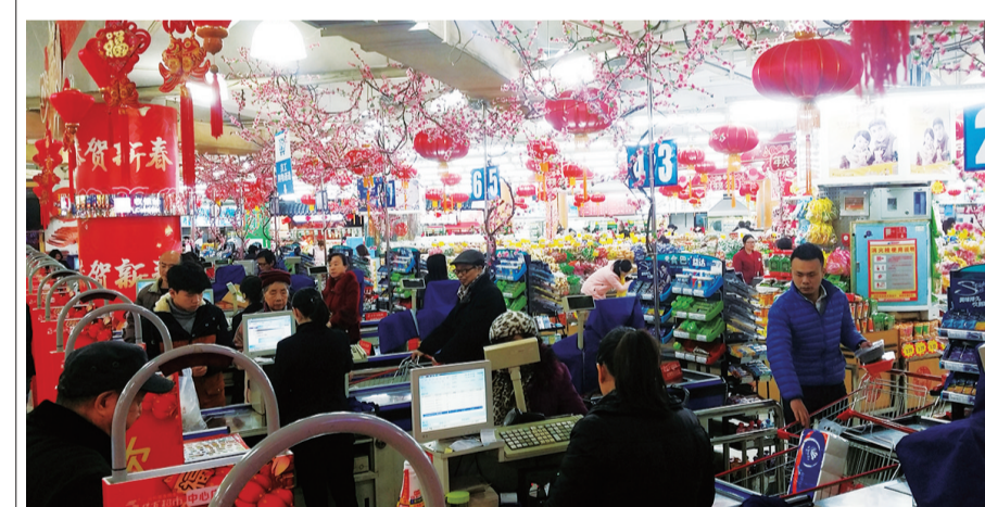
▲到株百,可一站式购置年货