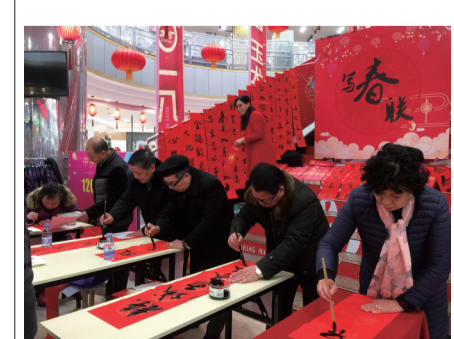
▲书法家现场写春联赠市民

据悉,今年株百的迎春购物节较往年更给力。株百超市11店数千种年货单品提前备货,折扣令人惊喜,百货服饰类冬靴4折起,名表8折,男女童装等冬装低至5折……各种优惠着实吸引了大量市民前来“寻年味、买年货”。商场随处可见丰富多彩的春节元素,热闹的氛围也极大地激发了市民的购物热情。