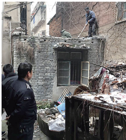
▲拆除现场

本报讯(记者 伍靖雯 通讯员 王奋强)地下敷设燃气管线,地上建有违章建筑,并且房屋内还有人长期居住,一旦引起管道破裂、燃气爆炸,后果不堪设想。昨日,芦淞拆违大队组织对这样一处违建进行了拆除。