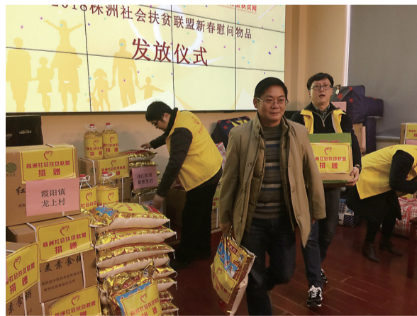
▲过冬物资发放现场

记者了解到,株洲社会扶贫联盟成立以来,通过整合全市社会资源,组织了“2017扶贫日主题活动”“株洲市阻断贫困代际传递助学行动”等活动,引导爱心团体、爱心企业等社会力量参与脱贫攻坚,目前已收到各类捐款捐物4000多万元,全部用于解决建档立卡户在住房、教育、医疗等方面的实际困难。2018年,联盟将继续引导社会力量参与脱贫攻坚,带动更多贫困户脱贫致富。