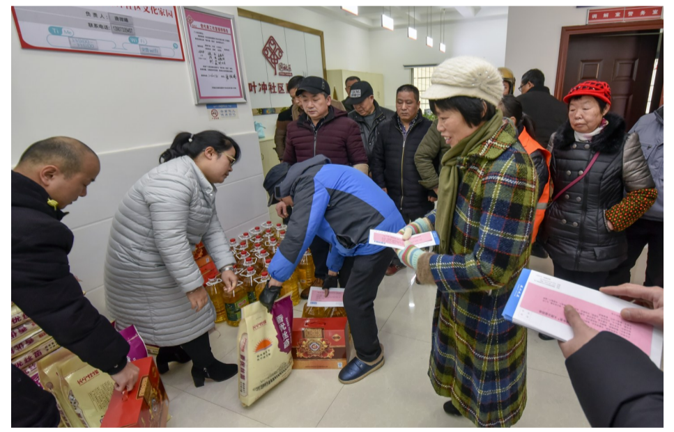
▲信佳百货代表为困难群众送爱心年货

今年,是华晨地产为特困群众送年货的第11个年头,华晨地产工作人员表示,为特困群众送温暖活动,还需要更多的人关注和扶持,一起帮助这些特困户改变困境。(记者 陈驰)