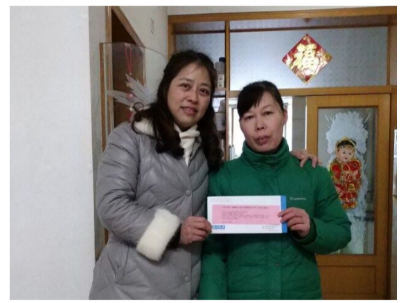
▲神骅地产代表(左)上门慰问困难群众