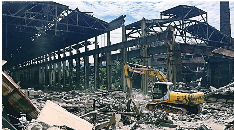
▲原株洲钢厂拆除现场