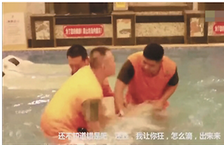
▲公众号“梁哥出击”视频内容,声称在洗浴中心对付黑心老板

晃动的镜头中,一位极具正义感的“大哥”在听取求助人的倾诉后,带领数名小弟出击,用暴力手段帮助求助者讨回公道。求助人的求助理由五花八门,如遭无良老板欠薪、社会人员勒索、讨债人员逼害、“渣男”坑害等等。