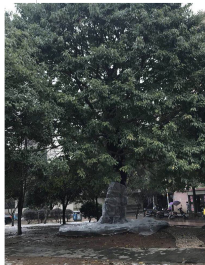
▲天元区和平路上的榕树裹着地膜保暖