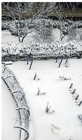
株州日报社大院一隅(资料图)