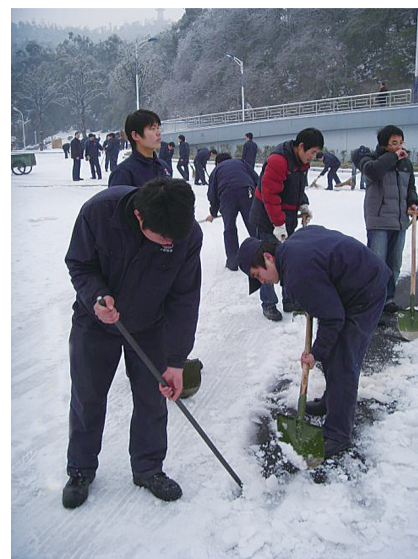
▲2008年冰灾期间,株州市民上街给道路除冰(资料图)