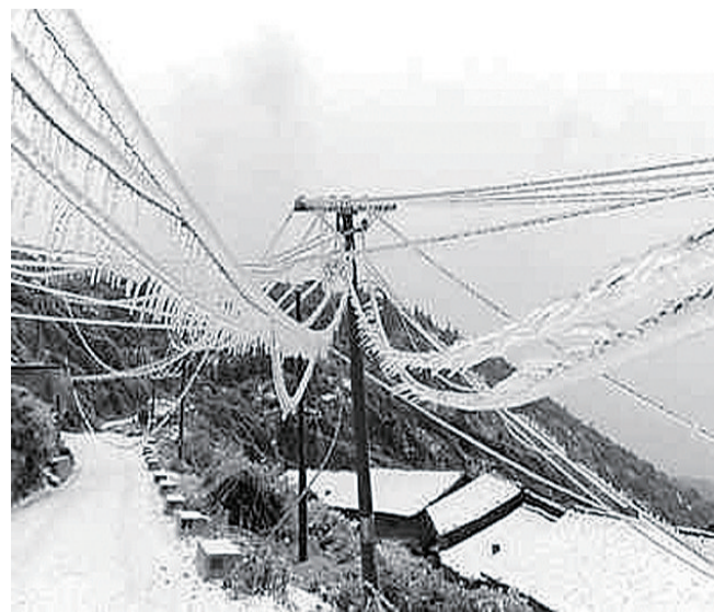
▲2008年冰灾期间的株州电网的一些线路一度覆冰达50毫米厚(资料图)