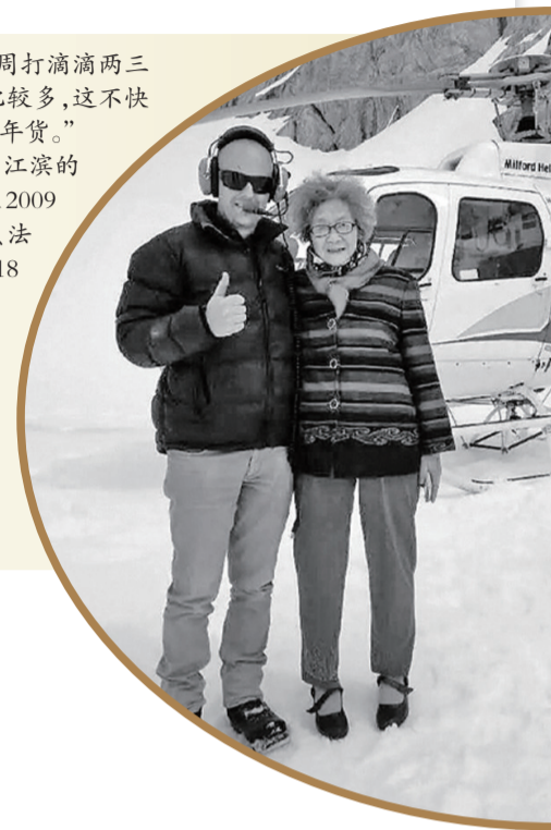
▶江奶奶在瑞士坐直升机上雪山

能够实现这浪漫理想的老奶奶,除了一颗大胆的心外,还尝试了另一种更大胆的生活方式,卖了房子周游世界享受生命。