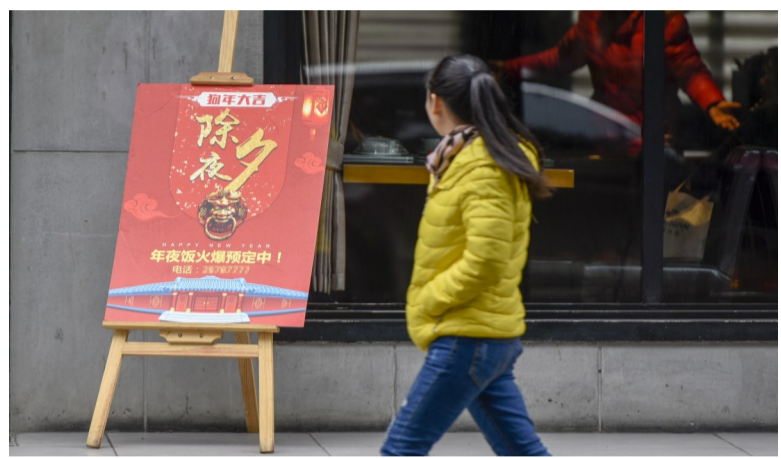
▲1月23日,市内各大酒店餐馆外,立着承办年夜饭的招牌

“价格是不一定的,要根据客人对菜品的需求而定。”上述餐饮店工作人员补充道,同时,店家一般都会用送酒、打折等方式吸引客人。