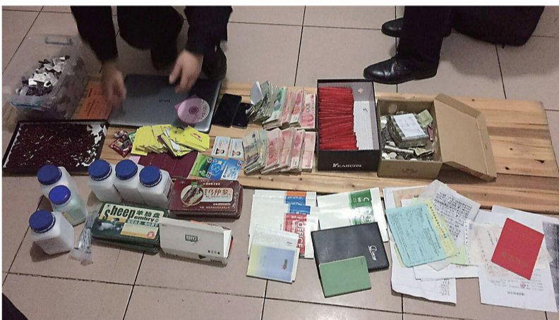
▲警方联合相关部门对“伊美时”进行查处,民警现场向老人讲解防骗知识