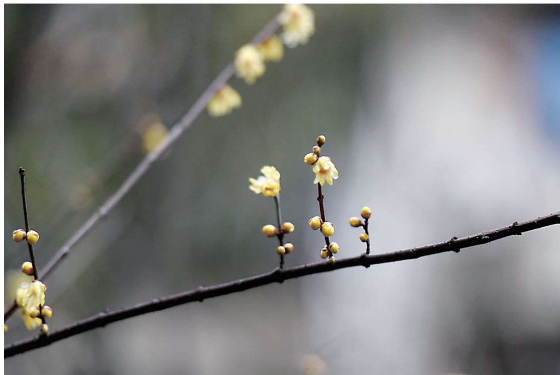
▲昨日,韶山路与黄河路交界处,倒挂枝头的小黄花在雨水的洗礼下“晶莹剔透”