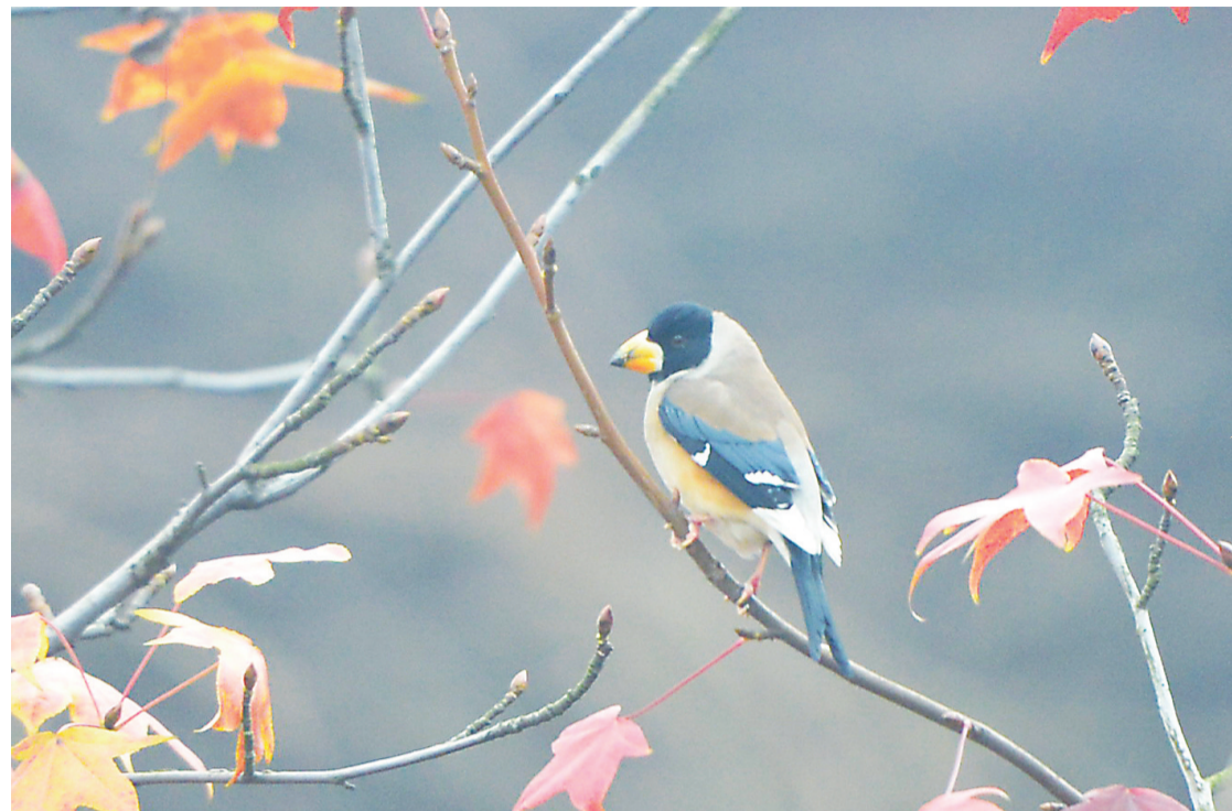
▲昨日,河西滨江路,一只小鸟站在稀落的枝叶上享受温暖阳光

不管前方的路有多苦,只要走的方向正确,不管多么崎岖不平,都比站在原地更接近幸福。 ——宫崎骏