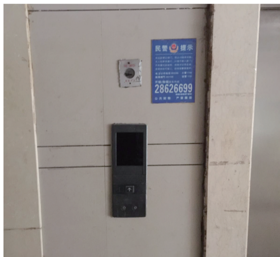
▲由于停电,小区电梯“罢工”

昨天下午,记者向国网湖南省电力公司株洲供电分公司求证,相关负责人介绍,城市风景停电的原因是由于其小区内变压器以及线路发生故障,导致小区供电跳闸,目前已经排除故障,恢复供电。