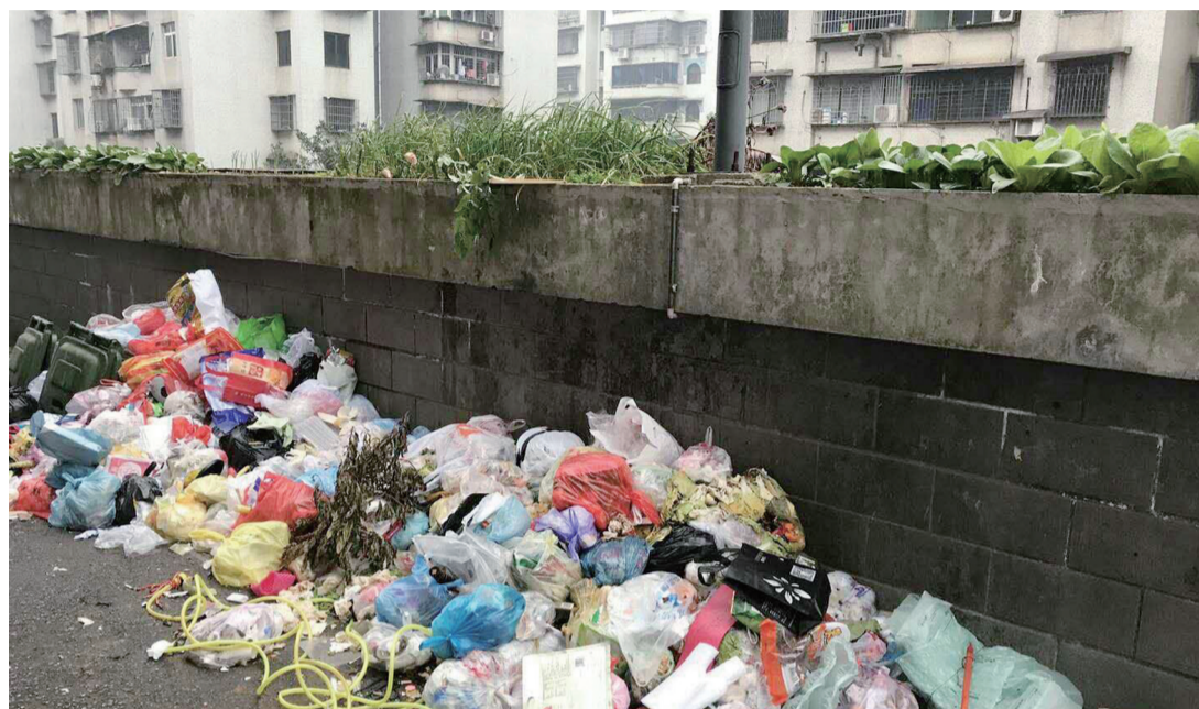
▲小区内垃圾随处堆放

本报讯(记者 陈驰)前两天,多名市民致电市长热线称,他们是天元区水陌华庭小区的业主,小区已经有半个月处于没有物业管理状态了,小区垃圾遍地,治安也很差,生活环境十分糟心。奇怪的是,这些投诉的业主,对于物业公司并没有多大意见,反而将矛头直指小区部分业主,这究竟是咋回事?