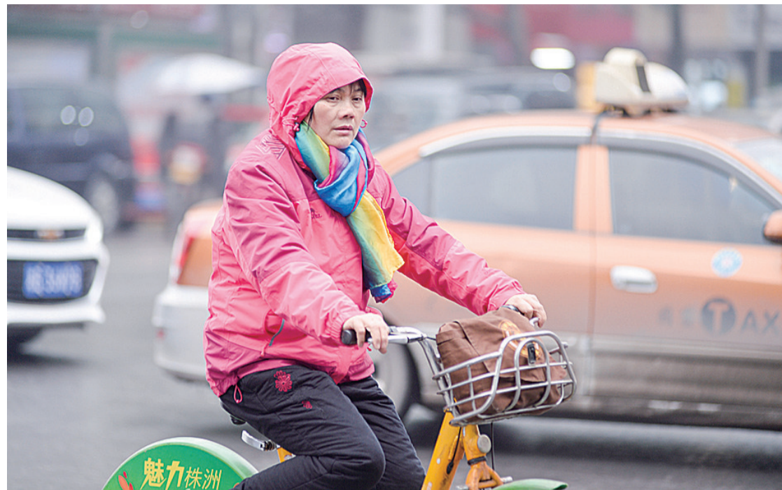
▲昨日,气温略有所降,新华西路新华桥段,一位市民在细雨中骑行

我们因未曾虚度光阴而感到欣慰,尽管不受到赞扬,不出类拔萃,只要不虚度一生,就该感到愉快。——达·芬奇