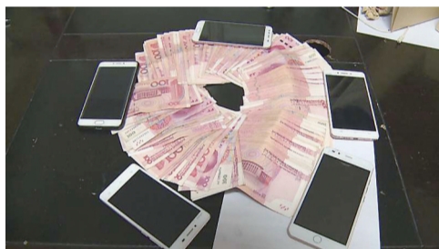
▲涉案手机与现金