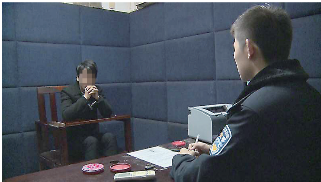
▲一名嫌疑人在接受审讯 通讯员供图