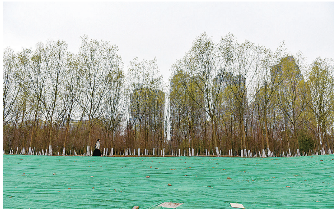
▲昨日,在河西风光带天元大桥段,市民从覆盖着蓝色保护膜的草地旁走过