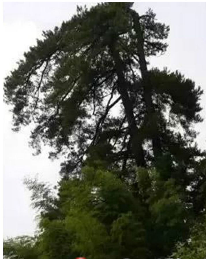
▲位于炎陵县鹿原镇东风村老屋背组、树龄680年的湖南“马尾松王”

本报讯(记者 何春林 通讯员 李茂春 范立华)记者昨日从市旅侨局获悉,由省绿化委员会、省林业厅主办的寻找“湖南树王”活动结果日前出炉,其中炎陵县鹿原镇东风村老屋背680年古马尾松获评“湖南树王”中的“马尾松王”,炎帝陵新殿前古罗汉松等6棵古树获评“湖南最美古树”。