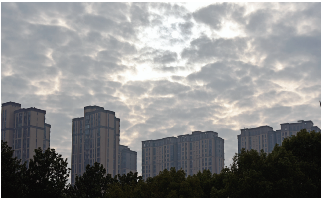
▲昨日,在荷塘区钻石广场,太阳被厚厚的鱼鳞云遮住,只露出少许面孔。记者 刘震 摄