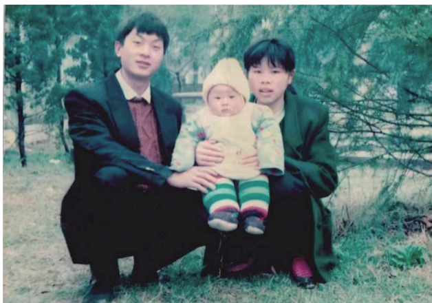
照片拍摄于1991年。如今我和妻子都是奔五的人了,小孩也已成家立业。没事翻阅昔日的老照片,仿佛又回返昨天!祝所有的读者朋友们青春永驻,快乐常相伴!