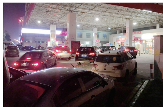
▲昨晚7点半,长江路一加油站,车辆排起了长队

有统计显示,在过去的2017年,国内成品油价格共经历了25次调整,呈现“11涨6跌8搁浅”,汽油累计涨幅为435元/吨,柴油420元/吨。(记者 戴凇)