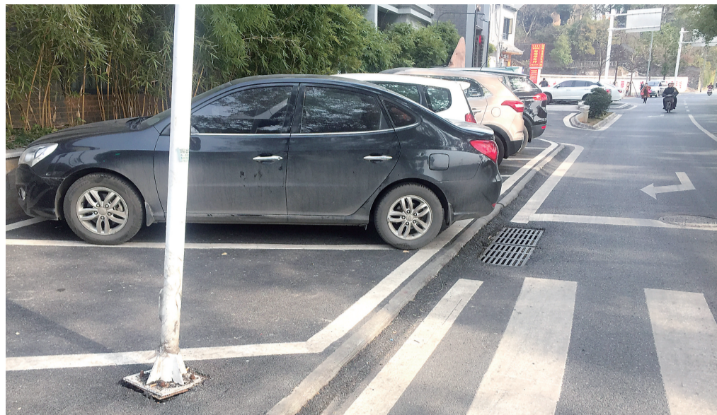
▲人行道被停车位占据