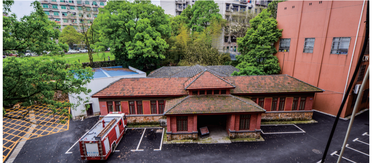
▲中车株机省级保护文物筹备处旧址