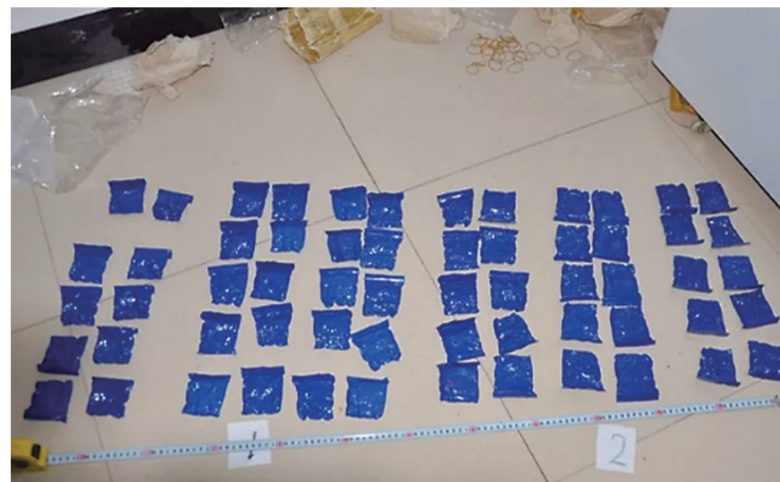
▲警方收缴的毒品

本报讯(记者 李卉 通讯员 阎俊 杨玲)近日,董家墩公安分局在邵阳、株洲等地全线收网,成功侦破“2017-112”号省厅毒品目标案件,抓获涉毒犯罪嫌疑人17人,收缴毒资20.98万元,缴获麻古1236.34克、大麻150.79克、冰毒46.25克。