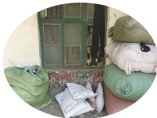
▲废品收购站门口摆放着打包好的旧衣物

这些旧衣物回收箱是否实现了设立的初衷?记者调查发现,不少爱心捐赠衣物遭到无良商家回收,再倒卖到市场。