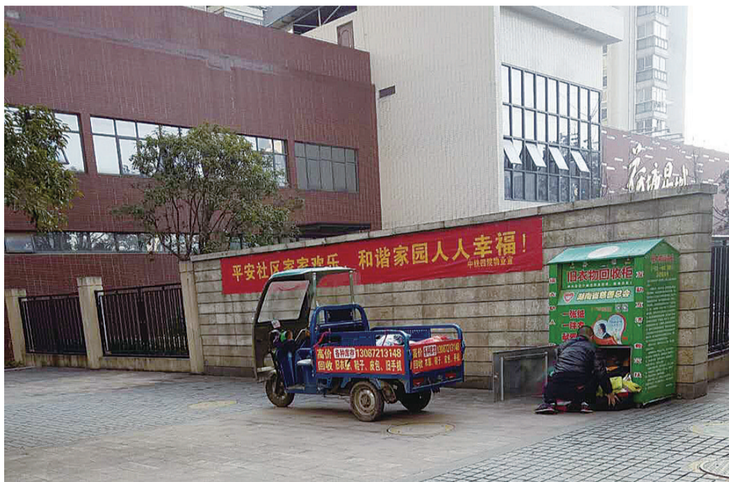
▲荷塘星城小区,一男子在回收柜中取出旧衣物,三轮车上贴有“高价回收旧衣物”的广告 受访者供图