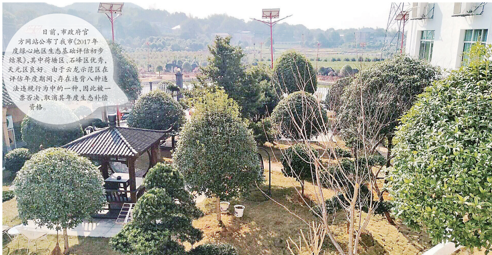
▲荷塘区樟霞村里满眼绿色

日前,市政府官方网站公布了我市《2017年度绿心地区生态基础评估初步结果》,其中荷塘区、石峰区优秀,天元区良好。由于云龙示范区在评估年度期间,存在违背八种违法违纪行为中的一种,因此被一票否决,取消其年度生态补偿资格。