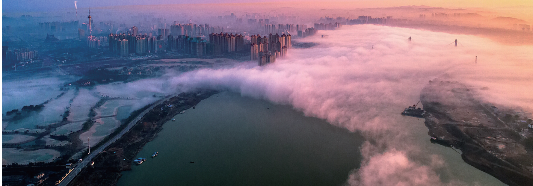
►平流雾滚滚而来,瞬间笼罩湘江两岸。

昨日清晨,雨后放晴的株洲出现难得一见的平流雾奇观,尤以三桥附近最为壮观。在无人机的“上帝视角”下,湘江两岸烟云弥漫,大面积云海涌动,各处高楼若隐若现,犹如仙境。记者了解到,平流雾与海市蜃楼、海滋并称海上三大奇观。由于前段时间我市持续降雨,空气湿度明显增大,天气放晴的清晨,暖湿空气移到较冷的陆地时,因下部冷却而形成平流雾,在适当的风向、风速下,平流雾就会形成悬在半空中的“飘带雾”。