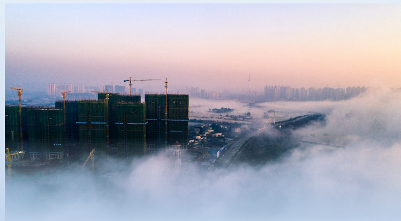
►城市在云雾中若隐若现,美轮美奂。