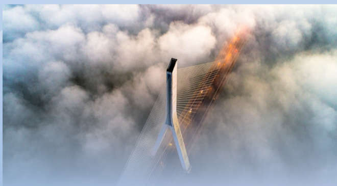
►湘江三桥仿佛云雾中的巨龙。