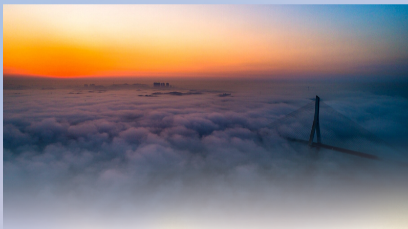
►朝阳下的云海,宛如仙境。