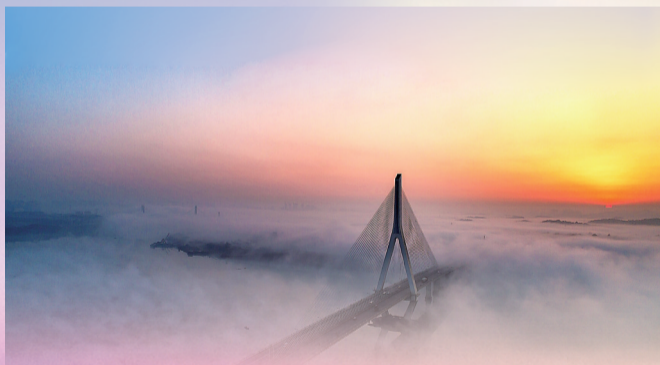
►湘江上的大桥仿佛架在云端。