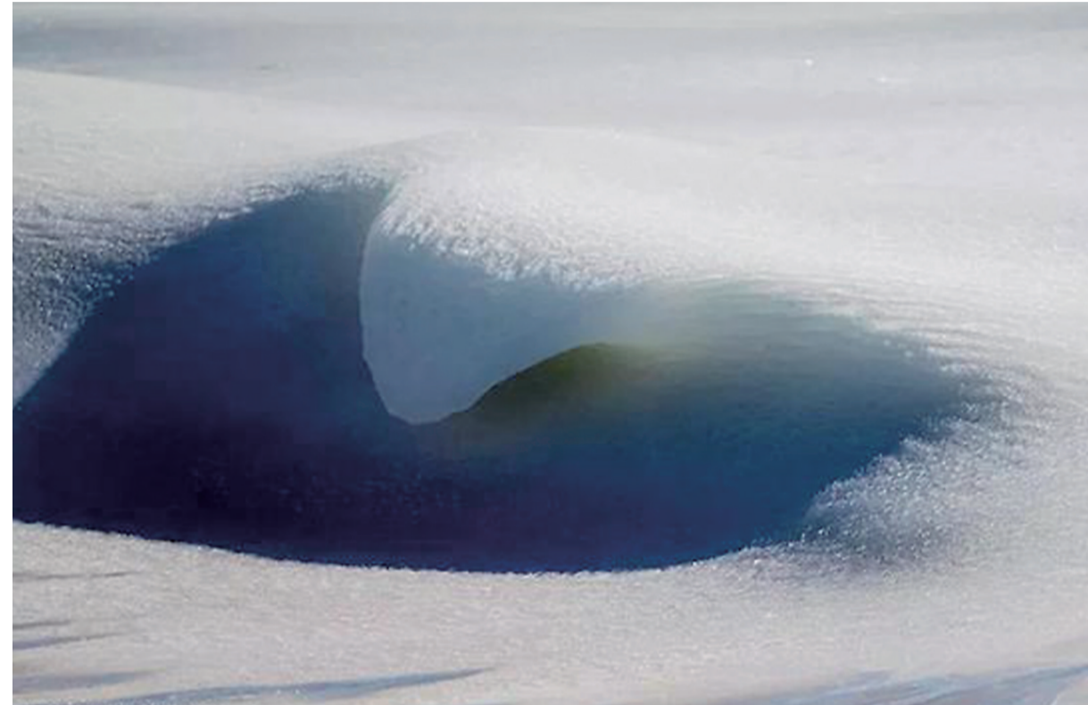
马萨诸塞州的海浪都被冻成了冰雕