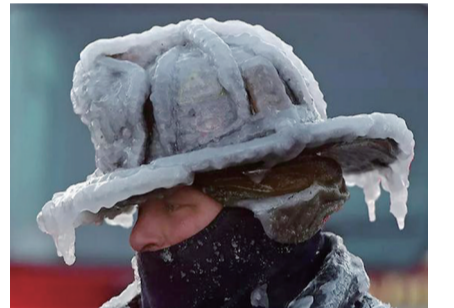
刚扑灭大火的消防员,帽子立刻成了这样