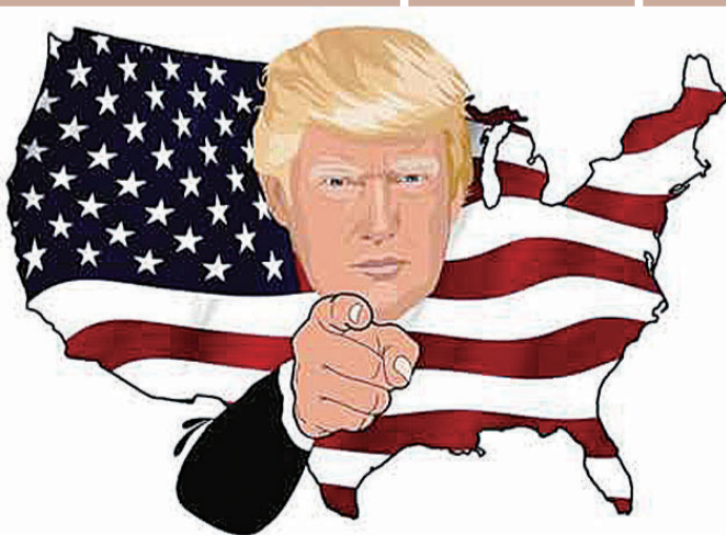
▲这次降低税收对美国而言究竟是福是祸?