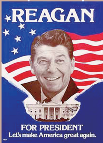
▲里根1980年的竞选海报