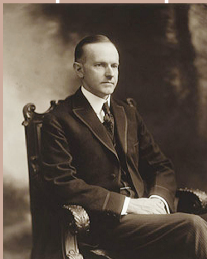
▲卡尔文·柯立芝执政时期是美国的黄金时代