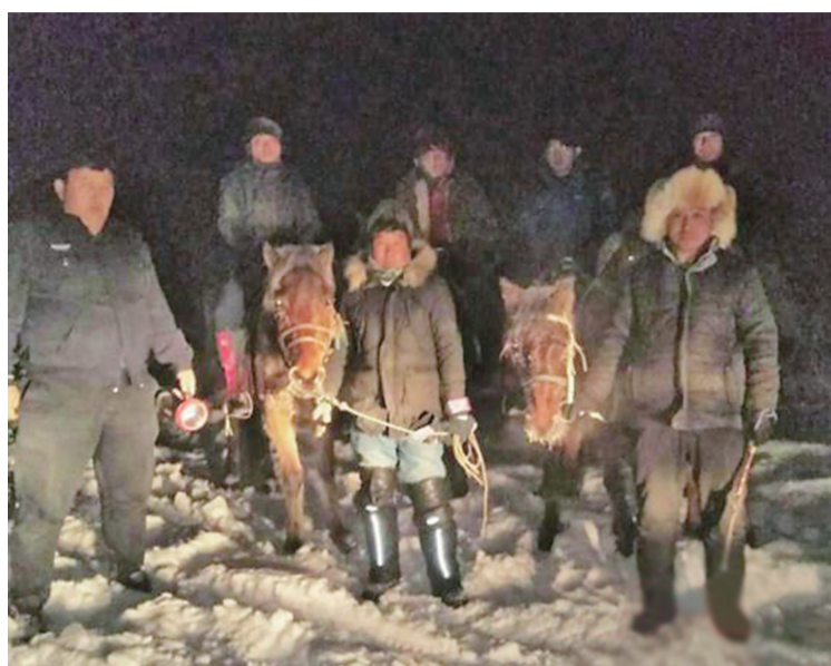
▲新疆警民救出被困驴友