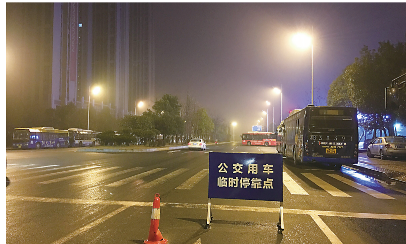
▲夜晚,长江南路市中心医院路段成了公交车临时的“家”

安监、国土、规划、交警等部门,尽早解决公交站场停放场地的缺口问题,解决危货运输车辆停放场地。 王波则认为,我市城市发展速度较快,广大市民对公交的要求也越来越高,应对新城区公交站场进行更为细致的规划,在规划过程中及时与交通运输部门沟通,按国家规范配套规划公交站场,并视具体情况规划足够的公交首末站和换乘枢纽站的建设用地。(记者 戴凜)