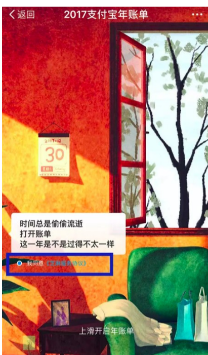
▲支付宝自动勾选服务协议