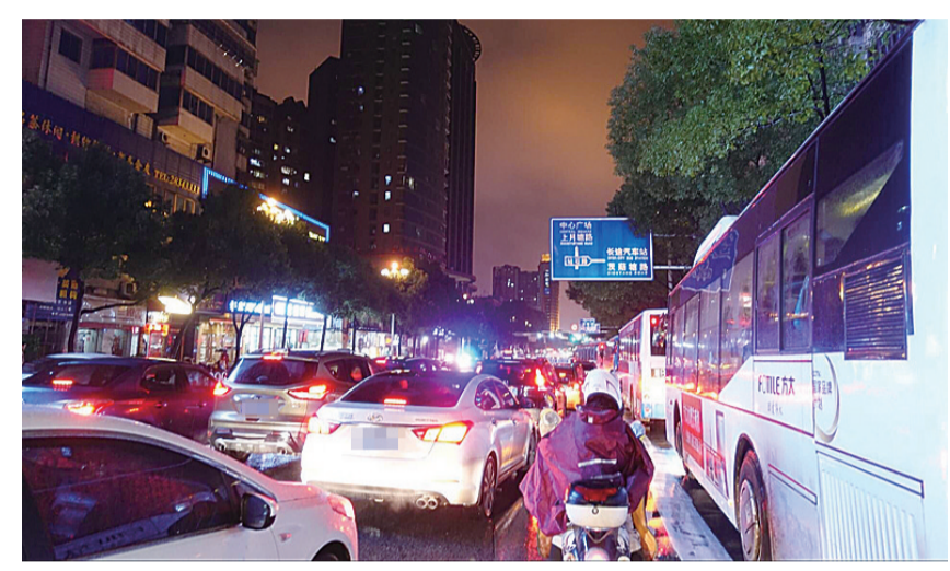
▲昨日傍晚6时30分,新华西路车辆排着长队