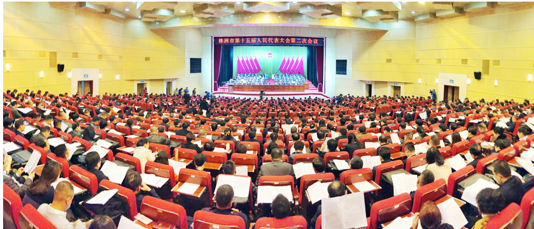
▲市十五届人大二次会议昨开幕

新时代开启新征程,新使命呼唤新作为。昨日上午,备受瞩目的市第十五届人民代表大会第二次会议在市政府礼堂隆重开幕。来自全市各行各业的市人大代表,肩负着全市人民的信任和重托,满怀豪情汇聚一堂,共商株洲发展大计,共绘株洲美好明天。