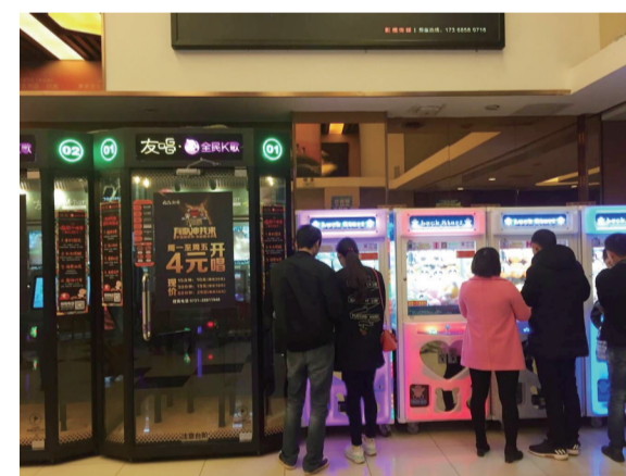
▲共享KTV无人问津,旁边的娃娃机很受欢迎