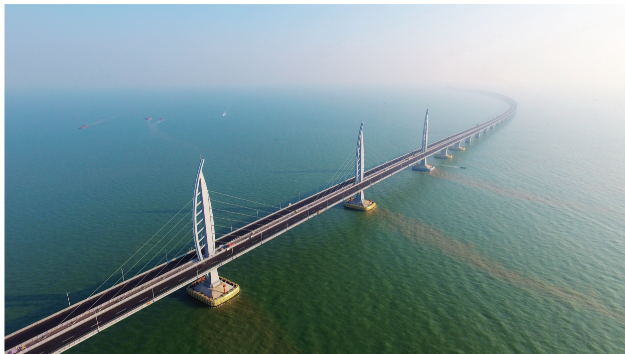
▲港珠澳大桥主体工程已经具备通车条件

此外,包括监察体制改革、养老保险全国统筹、嫦娥四号奔月等在内,2018年一系列关系国计民生的大事也值得关注。